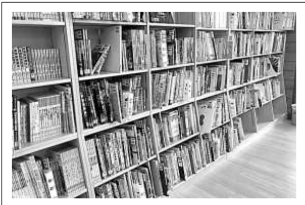
書架サインが入った4類の本棚