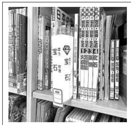
前からも、横からも見やすいサインです