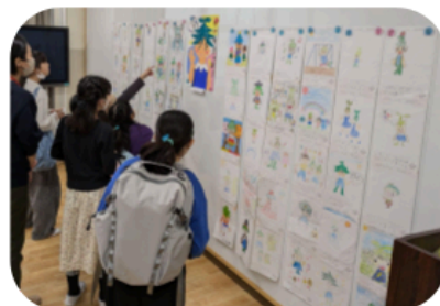
児童が描いたすぎっぴーの展示