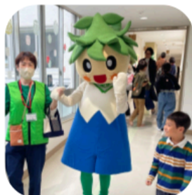
児童に大人気のすぎっぴー