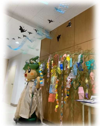
七夕のすぎっぴーコーナー

私たちが生活している中で「待つ」事はかなりあります。急いでいる場合など時には「イライラ」してしまうこともあるでしょう。しかし実は子育てや教育、友人との関係性などにおいて、「待つ」ことはとても大切な事なのです。相手に待ってもらえると、安心して気持ちが落ち着き、良いアイデアが浮かびます。結果が予想できる大人は、どうしても急いでしまいがち・・・。